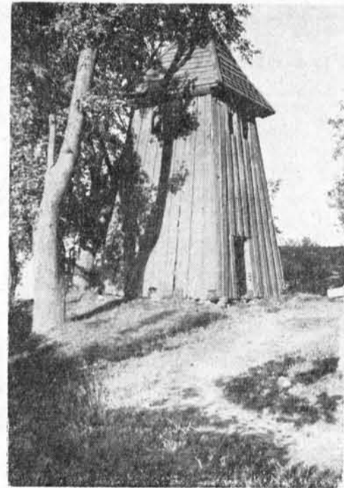
Den letzten hölzernen Glockenturm neben einer Kirche im Kreise Allenstein sah der Verfasser in Wuttrienen.

Die Besiedlung der Gegend um Allenstein fand in der Blütezeit des Ritterordens statt, als Winrich von Kniprode Hochmeister war. Zwischen 1348 und 1353 wurden die Burg Allenstein und die Jakobikirche erbaut, bald danach folgte die Errichtung der Pfarrkirche in Wartenburg. Auf dem Lande gab es natürlich die Siedlungen des prussischen Bauernvolkes, das Städte noch nicht kannte. Welche Dörfer damals zu Kirchspielen wurden, sagen uns die Handfesten, die Gründungsurkunden, der einzelnen Orte. Die ersten Kirchen dieser noch kleinen Siedlungen wurden verständlicherweise aus Holz gebaut. Darum hat sich keine von ihnen erhalten, zumal das Land 1410 unter dem Kriegen gegen Polen, dann dem Dreizehnjährigen Kriege von 1454—1466 und dem Pfaffenkriege von 1478 schwer zu leiden hatte. Allenstein, Guttstadt, Wormditt und andere Städte und erst recht die wehrlosen Dörfer wurden geplündert und verbrannt. Erst Ende des 15. Jahrhunderts begann man in den Dörfern massive Kirchen zu errichten, nicht nur, weil die Bevölkerung und Wohlhabenheit gewachsen waren, sondern auch, weil eine massive Kirche bei Überfällen und Kämpfen als fester Zufluchtsort dienen konnte. Damals entstanden massive Neubauten der Kirchen in Dietrichswalde, Göttkendorf, Neukockendorf, Schönbrück und Alt-Schöneberg.