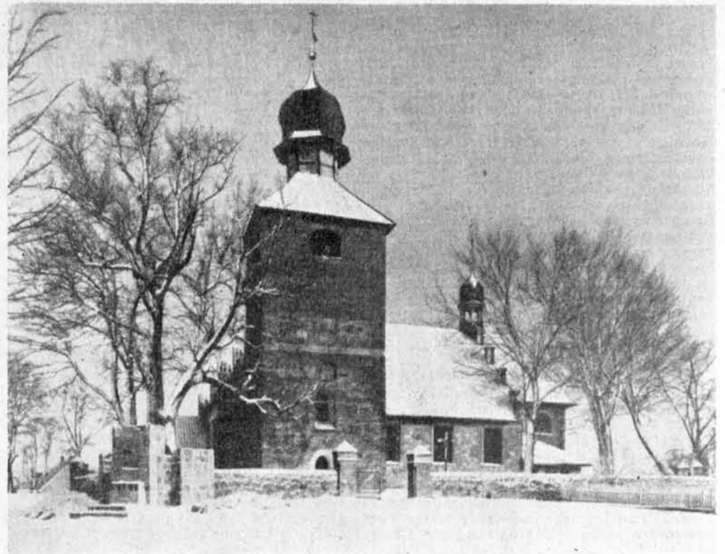
Die weiße Schneefläche und das verschneite Dach lassen die schlichten Bauformen der Kirche von Schönbrück klar hervortreten. Die 1790 auf den Turm gesetzte Haube und die Kuppel des Giebelreiters wirken hier nicht störend; ihre Kurven bilden einen reizvollen Gegensatz zu den horizontalen und vertikalen Linien des Baues. — Bereits in einer früheren Folge brachte das Ostpreußenblatt eine Zeichnung von dieser Kirche, worauf die nebenstehende Zuschrift Bezug nimmt.

Auch das 19. Jahrhundert hat hier und dort Spuren an den Kirchen hinterlassen. Aber diese Zeit hat im allgemeinen, da der Sinn für das Historische noch gewachsen war, das Alte wenig verändert. Neu gebaut wurde 1831 die Kirche in Gr.-Lemkendorf. Seit 1870, begünstigt durch die Ostpolitik des Reiches, nahm Allenstein und mit ihm seine Umgebung einen sehr starken Aufschwung. Die Bevölkerung der Stadt wuchs durch neue Bürger, die aus dem Reiche oder anderen Teilen Ostpreußens kamen. In Allenstein entstanden zwei protestantische Kirchen, die Pfarrkirche und die Garnisonkirche, und im Landkreise ebensolche in Wartenburg und Gelgahnen, ohne das Allgemeinbild zu ändern, denn auch die katholische Kirche entfaltete neue Kräfte und diese Bemühungen kamen wiederum dem Kirchenbau zu-