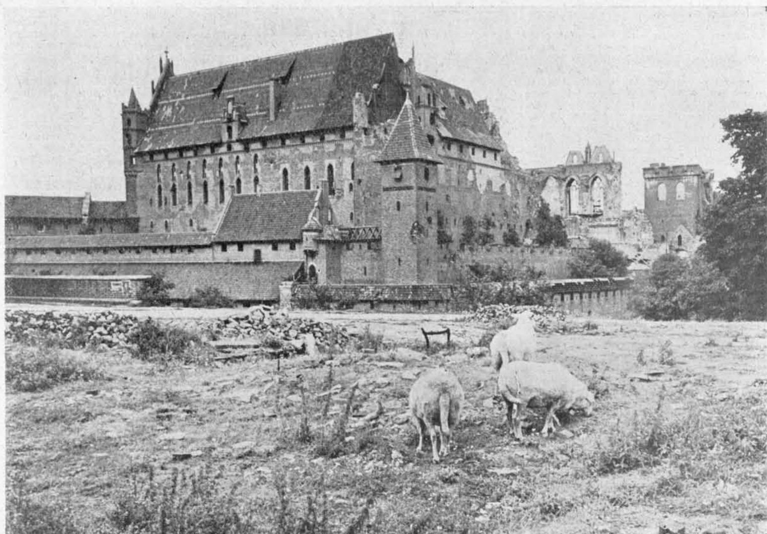
Ein erschütterndes Bild: Schafe weiden auf dem Trümmelfeld ehemaliger Wohnhäuser vor der stark zerstörten Marienburg. Dieses Bilddokument wurde wenige Tage vor dem Brand in der Marienburg (September 1959) aufgenommen.

Fast wie in vergangenen Tagen: Blick auf Nikolaiken und die kleine Inse! Im Vordergrund stehen allerdings keine Landsleute, sondern Polen und Ukrainer.