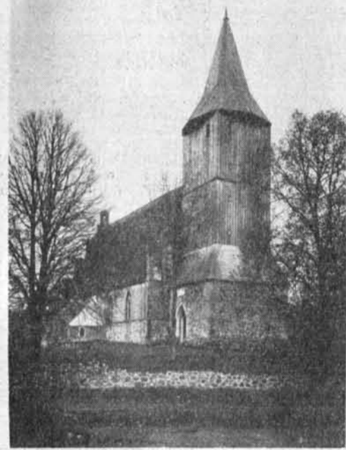
Im 18. Jahrhundert wurde auf einem älteren Unterbau aus Findlingen in Holz der Turm der Kirche von Alt-Schöneberg errichtet. Auch das gegen Ende des 15. Jahrhunderts gebaute Langhaus steht auf einem hohen Feldsteinsockel.

1604—1627 erbaute man die Klosterkirche in Wartenburg und 1631 die kurz zuvor abgebrannte Kreuzkirche in Allenstein (abgetragen 1803). Sonst hören wir in dieser ganzen Zeit nichts über eine Bautätigkeit. Erst Ende des 17. Jahrhunderts, als mehrere der alten Kirchen verfielen, setzte ein neuer Bauabschnitt ein. In den Jahren 1714—1730 wurden die Kirchen in Wuttrienen, Gr.-Bertung, Gr.-Raumsau, Jonkendorf und Klaukendorf neu gebaut, von denen die drei letztgenannten dem hl. Rochus, dem Schutzheiligen der Pestkranken, geweiht wurden, da kurz vorher, in den Jahren 1709—1711, die Pest furchtbar gewütet hatte. Ende des 18. Jahrhunderts nahm man eine An-