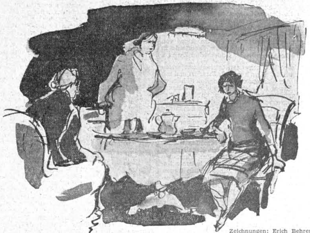
Zeichnungen: Erich Behrendt

Sehr bald kam sie wieder, ergriff die leere Reisetasche und das Köfferchen, die sie beide vorsorglich auf dem Bänkchen vor dem Kreuz abgestellt hatte, schob ihren rechten Arm unter den der noch ganz Versunkenen, sagte: „So, — nun wieder eins, zwei zum Essenlassen! Wie im Lager!“ und zog die immer wieder Zurückblickende zum Pförtchen und über den schrägen Weg zu den Stufen vor ihrer Haustür. Schon im schmalen Flur — das junge Schlesierviertel schien verreis zu sein —, schlug ihnen behagliche Wärme, Tannenduft und Kaffeegeruch entgegen. Oma Kretschmann schloß ihre Wohnungstür auf, knipste das Licht an und wies nicht ohne Stolz auf den gedeckten Kaffeetisch, der da mit einem weißbezugten Napfkuchen zwischen blaueblühten Tassen neben der dicken braunen gehäkelten Kaffeehaube auf sie wartete. In der Ecke vorm Kleiderspind flimmerten das Engelshaar und der Strohstern eines kleinen Tannenbaums, über der Papierkrippe auf dem niedrigen Tisch. Und überm Vertiko, an der Tür, grüßte das große bunte Muttergottesbild über dem Christrosenstrauß zwischen den Photographien der Söhne.