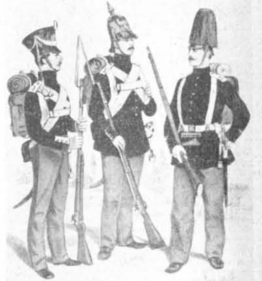
Uniformen der 3. Grenadiere im vorigen Jahrhundert seit den Freiheitskriegen: 1832 diente der Tschako als Kopfbedeckung. Der Grenadier von 1842 trug die hohe „Pickelhaube“, wie der damals eingeführte, mit einer Metallspitze versehene Lederhelm genannt wurde. 1885 zierte ein herabfallender Busch bei Paraden den Helm. Eine Erleichterung verschaffte dem Infanteristen die Anordnung zum Tragen des Tornisters, der Patronentasche und des Seitengewehrs. Die die Brust einschneidende Bändelriege fielen fort, Trageriemen und Koppel ersetzten sie.